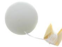
Balle de Ping pong avec fil