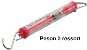
Peson à ressort