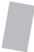
Feuille de carton