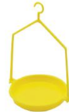
Plateau de pesée