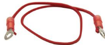
Élastique avec oeillets