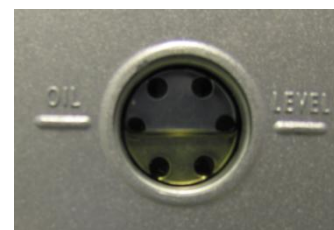
Le niveau d'huile observé ici est de 1/2

1 – Desserrez le bouchon noir de l'orifice d'évacuation. Utilisez un entonnoir pour verser l'huile. Pendant le remplissage, vérifiez le niveau: le volume optimal est obtenu lorsque le niveau se situe entre les deux lignes « min » et « max ». Refermez le bouchon après remplissage.