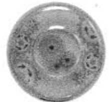
Motion Display (Gears)