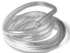
Water Turbine Pipes