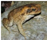
2. Aga-Kröte in Australien