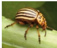
3. Kartoffelkäfer in Europa

Verfasst einen kurzen Bericht und präsentiert ihn vor der Klasse.