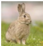
1. Wildkaninchen in Australien

Bildet drei Gruppen und recherchiert im Internet jeweils einen der folgenden Fälle: