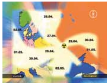
Tschernobyl – Die Ausbreitung der radioaktiven Wolke (Animation)

Ergänzend werden im ROM-Teil der DVD zahlreiche Materialien (Arbeitsblätter, Infoblatt, Grafiken, Bilder usw.) als PDF-Dateien angeboten. Die Datei unter der Rubrik „Verwendung im Unterricht“ gibt Hinweise zum Einsatz im Unterricht sowie detaillierte Beschreibungen der einzelnen auf der DVD vorhandenen Materialien.