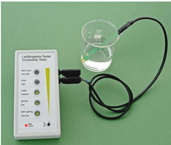
Bestimmung der Leitfähigkeit in Flüssigkeiten