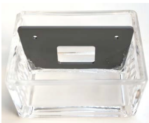
Aufbau 1: Zelltrog ohne Diaphragma