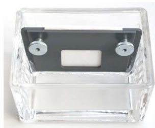
Aufbau 2: Zelltrog mit Diaphragma