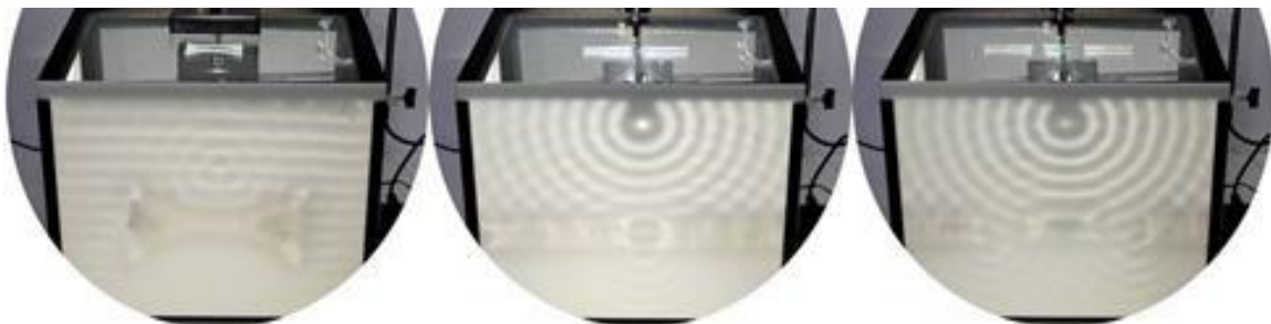
Abbildung 1: Verschiedene Hindernisse im Wellenbild.