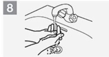
8 Seife abwaschen;