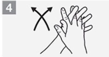
4 Handfläche auf Handfläche, Finger-Zwischenräume reinigen;