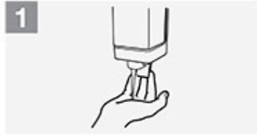
1 Seifenmenge muss beide Hände komplett einseifen können;