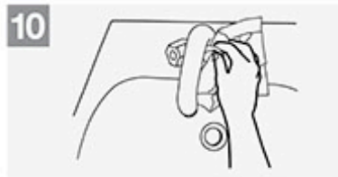
10 Wasserhahn mit Einmalküchentuch zudrehen, Hautkontakt vermeiden;