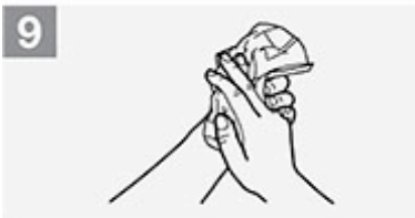
9 Hände mit Einmalküchentuch gründlich abtrocknen;