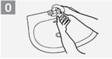
0 Hände mit Wasser anfeuchten;