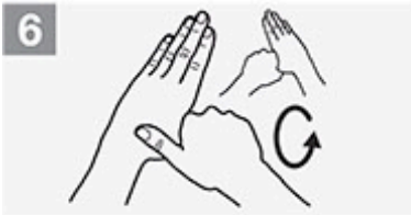
6 Linker Daumen in rechter Faust, Drehbewegung, Seitenwechsel;