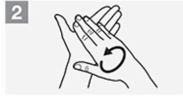
2 Handflächen gegeneinander reiben;