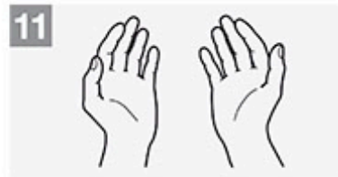
11 Die Hände sind nun sauber.