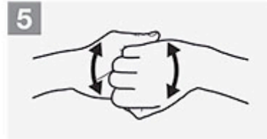
5 Finger verschränken (Finger-Rückseiten reinigen);