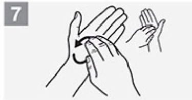
7 Fingerspitzen auf Handfläche reiben, Seitenwechsel;